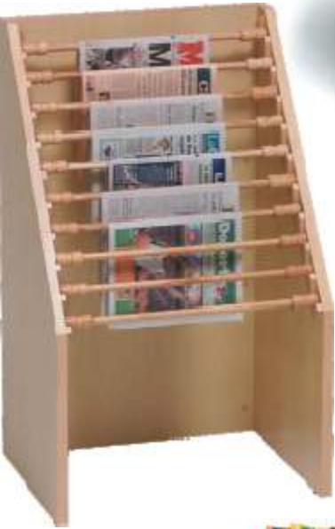
Ref. 115 H8160129 Expositor de periódicos