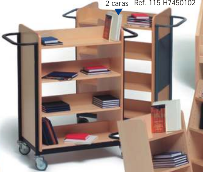
Carro portallibros 2 caras Ref. 115 H7450102