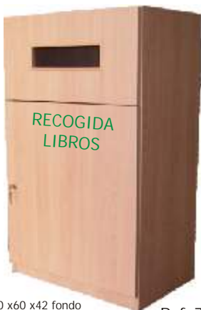
Buzon de recogida libros fuera de horario Ref. 78 500