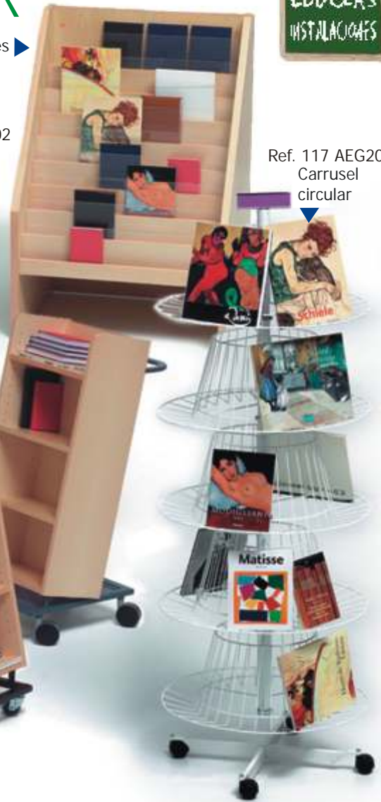
Ref. 117 AEG200 Carrusel circular