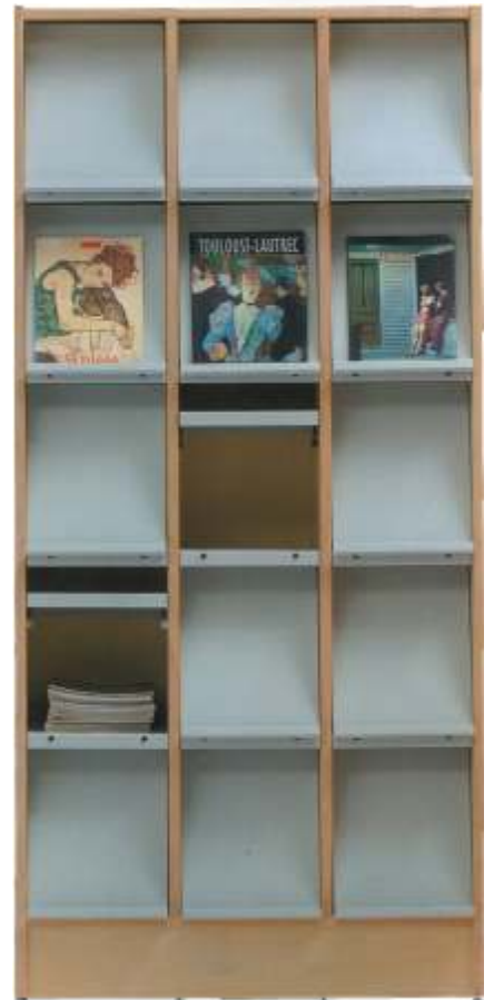
Ref. 115 MRCI-2010