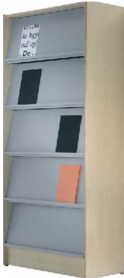
Ref. 115 MRSI-2090