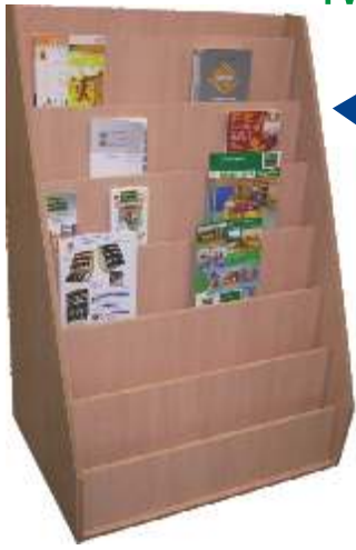
Expositor novedades Ref. 78 700