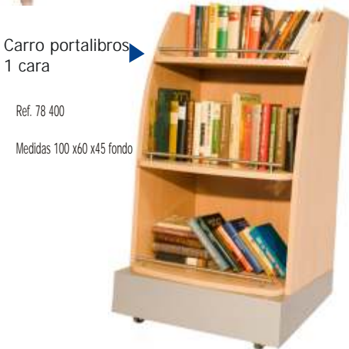
Carro portallibros 1 cara